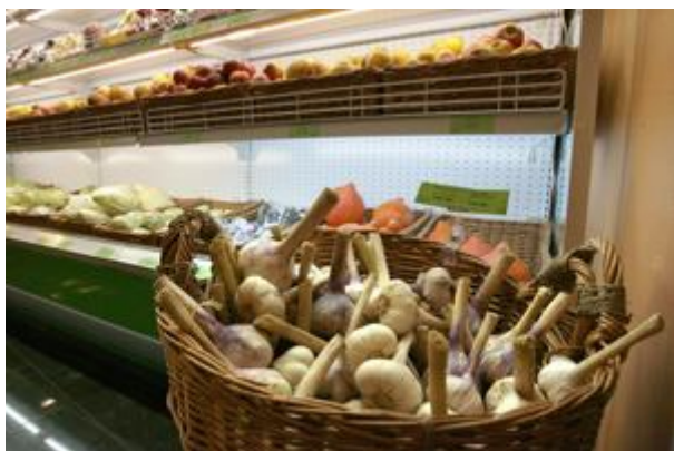
Проводниками возрождения национального рынка стали ритейлеры и торговые центры.

Как сказал бы французский социолог Пьер Бурдьё, если люди-XXI и являются классом, то скорее «классом на бумаге», не в смысле искусственности самой группы, но в смысле ее распыленности в различных более крупных социальных и территориальных образованиях. Эта группа не проявляет себя как общность, пока не возникнет ситуация, угрожающая ее жизненному укладу. Пока же по своему уровню политического сознания и потенциала коллективной мобилизации люди-XXI почти не отличаются от населения в целом.